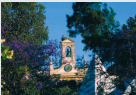
Kathedrale in Faro

Eine besondere Mitgliederreise des BAVC zusammen mit dem DAC e.V. führt Sie vom 20. bis 27. Oktober 2004 an die Algarve und nach Lissabon.