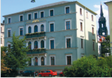
VCH Hotel Martha Hospiz in Dresden

Die historische Altstadt von Dresden ist allein schon eine Reise wert. Doch in der Umgebung der Sächsischen Schweiz locken zudem noch reizvolle Landschaften und zahlreiche Sehenswürdigkeiten.