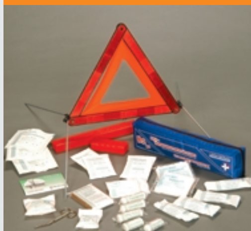
Notfallset: Pannen-Warndreieck „Mini XS“ Euro Ausführung inklusive Kfz-Verbandskastenfüllung DIN 13164 Maße: ca. 440 x 105 x 50 mm