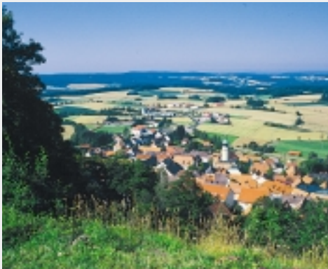
Tännesberg im Oberpfälzer Wald

Mit der jeweils am 4. Sonntag im Juli stattfindenden Pferdewallfahrt St. Jodok-Ritt wird in Tännesberg der Überwindung der großen Viehseuche gedacht, der 1796 an die 200 Tiere zum Opfer fielen. Aus Dankbarkeit und zu Ehren des Viehpatrons St. Wendelin gingen die Tännesberger darauf Jahr für Jahr in feierlicher Prozession nach St. Jodok. 1950 wurde die in Vergessenheit geratene Pferdewallfahrt erstmals wieder veranstaltet. Seither findet sie jedes Jahr statt, begleitet von einem historischen Festumzug samt mittelalterlichem Markttreiben. BAVC-Mitglieder erhalten auf dieses Viabono-Reiseangebot 10 % Rabatt.