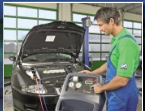
Moog, Moog & Morgenstern, Koblenz

Unter www.point-s.de finden Sie im Internet ganz schnell die Servicecenter in Ihrer Nähe und welchen Service Ihnen diese bieten.